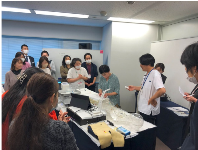
コンテストの様子